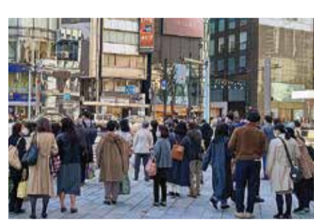
新型コロナウイルス変異株の感染動向に左右され、景気の見通しも持ち直し・回復傾向が流動的です

「景気ウォッチャー調査(内閣府)12月は4カ月連続の上昇」 景気の指標となっている内閣府が公表する令和3年12月の景気ウォッチャー調査は、景気の現状判断DIが56・4ポイントと、4カ月連続の上昇となっています。また、「景気は新型コロナウイルス感染症の影響は残るものの、持ち直している。先行きについては、持ち直しが続く」とみているものの、コスト上昇等や変異株をはじめ内外の感染症の動向に対する懸念がみられる」としています。なお、2〜3カ月前の景気の見通しに対する判断DIは、前月を4・0ポイント下回る49・4とまとめています。 「ざくらのレポート(日本銀行)「持ち直しの動きがみられている」」 日本銀行が1月12日開催の支店