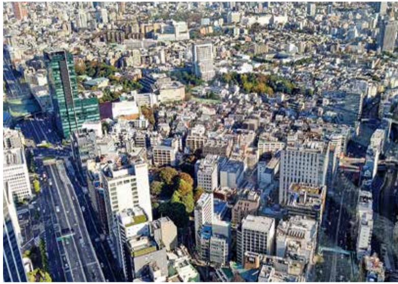
お客様との窓口業務は、非接触・非対面型サービスに比重がかかっていますが、従来通り直接ご来店いただくケースも少なくありません

お客様との窓口業務は、非接触・非対面型サービスに比重がかかっていますが、従来通り直接ご来店いただくケースも少なくありません。例えば賃料の傾向は、全体傾向としてやや軟調、横ばい気味にありますが、不動産情報サービスのアットホーム(株)が発表した2021年11月「賃貸マンション・アパート募集家賃動向」によると、「マンション」の平均募集家賃は、前年同月上昇率トップ3に東京都下・神奈川県が全積み帯でランクインするなど首都圏エ