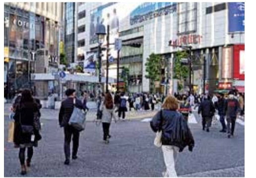
4月1日以降の契約には、契約開始時の満18歳の確認が必要となってきます

成年年齢の改正に対して政府は、「成年年齢を18歳に引き下げることには18歳、19歳の若者の自己決定権を尊重するものであり、その積極的な社会参加を促すことになると考えられる」と、説明しています。