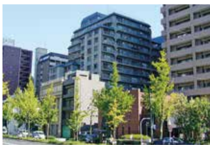
物件選びで重視されるポイントを活用して、契約の促進を図りたいものです

データを男女別に見ると、女性は男性に比べ、全ての項目において重視するポイントが高いという傾向で、とくに上位3項目に加え、「築年数」