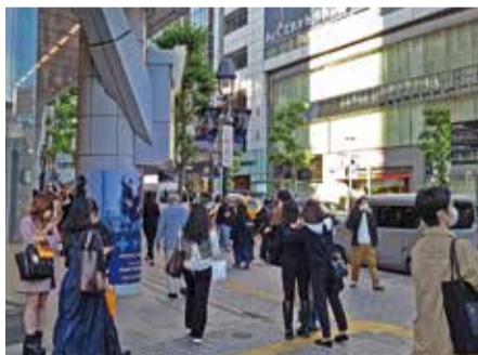
金融緩和等を背景とした、賃貸住宅投資の意欲は底堅いようです