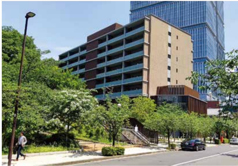
まだまだ新型コロナウイルス感染症の動向には目が離せませんが、今後、為替市場の傾向や海外の投資用不動産に対する動きが注目されます

また、共同住宅における子どもの安全確保や親の交流機会の創出を支援する「子育て支援型共同住宅推進事業」の令和4年度の募集が、6月1日から開始されました。応募期間は令和5年2月28日までですが、予算執行状況を前倒しで終了する場合があります。令和3年度補正予算で創設された新制度で、子育て支援として今後も継続的に予算が組