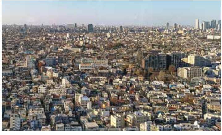
思いがけない資材価格の上昇が、工事単価のコスト増の要因になっています

建設資材や工事費の上昇が建物の修繕・補修をはじめ、リフォーム、原状回復の工事費用に影響を及ぼしています。賃貸住宅経営における管理面から資材価格上昇の近況を見ていきます。