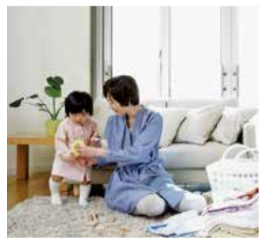
従来になかった、賃貸住宅入居者を対象とする子育て支援事業が始まっています

例年になく今年の天候は変則気味で、気温のアップダウンに悩まされます。ウイズコロナのもと、様子を見ながらお客様に対応させていただいてありますが、半年を過ぎ、賃貸市場を取り巻く環境の変化は、一段とスピードアップした印象を受けます。