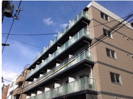
蒲田四丁目プロジェクト E-type 27.62㎡