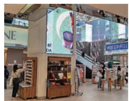
諸物価高騰や経費上昇の影響が懸念されています

国土交通省が公表した2025年の11月と第3四半期の「不動産価格指数」によると、住宅総合は前月比0.7%増の147.3、商業用不動産総合は前期比で1.1%増の147.2となりました。 第3四半期の商業用不動産のうち、店舗が同3.4%増の169.5、オフィスが同5.9%減の168.5、マンション・アパート(一棟)が同0.7%増の173.7となつています(2010年の平均を100として算出)。