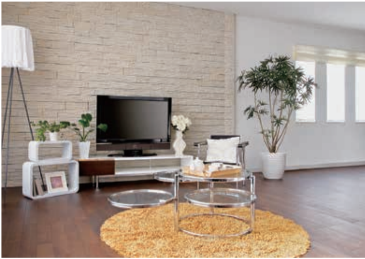
賃貸市場において、募集家賃が顕著に推移する中、春の繁忙期も後半に入り、賑わいを見せている一方で、不安要因も浮上しています

そうしたことから、「前年同月を上回り」「最高値を更新」「過去最高を更新」といった発表が相次いでいます。 1月の全国主要都市の「賃貸マンション・アパート」家賃動向(アットホーム調べ)では、マンションの平均募集家賃が、首都圏始め全国10エリアの全面積帯で前年同月を上回っています。 ファミリー向きが5カ月連続して全13エリアで前年同月を上回り、シングル向きでは東京23区が20カ月連続で2015年1月以降、最高値を更新。東京23区は7カ月連続で全面積帯において最高値となり、アパートは東京