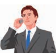
賃貸経営ワンポイントアドバイス

く住んでいただけでは、これほどありがたいことはありません。ですから退去希望者を少なくし