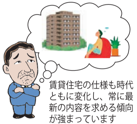
賃貸住宅の仕様も時代とともに変化し、常に最新の内容を求める傾向が強まっています

新築賃貸物件の設計担当者が「燃費のいい賃貸住宅」の性能を分かりやすく紹介。実際の物件で撮影することで、暮らしの中で感じられる快適性や光熱費削減といったメリットをよりイメージしやすくなっています。物件を探す若年層にも役立つ、住まい選びの新しい視点を提供する内容です。