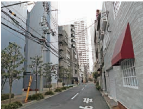
入居者に満足してもらい、長く入居してもらうコツは、このように入居者に対して常に「顧客満足度」を感じてもらえるサービスの充実を、入居者の長期居住を実現する、それがひるがえつて賃貸経営の安定につながるという流れになります。

賃貸住宅は家賃に見合った、立地・周辺環境等の「条件」と、宅配ボックス・温水洗浄便座等の「設備」が備わって総合的に評価されている